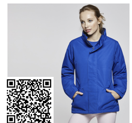
EUROPA WOMAN PK5078