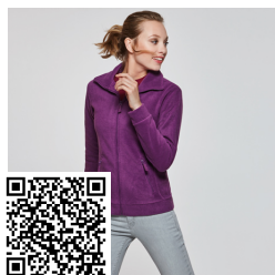
PIRINEO WOMAN CQ1091