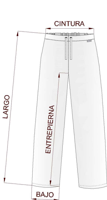
FIG. 1. MEDIDAS