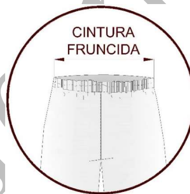
FIG. 3. CINTURA FRUNCIDA